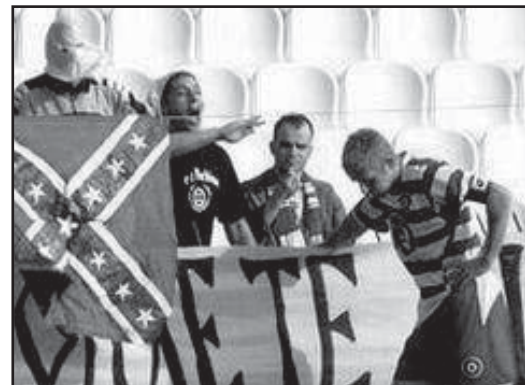
Navijači "Borca" sa kapuljačama i rekvizitima Kju Kluka Klana

Naime, kao što je, na žalost, slučaj i sa većinom evropskih naroda, neki Srbi jesu bili fašisti. Još 1935. godine u tadašnjoj Jugoslaviji osnovan je pokret "Zbor" Dimitrija Ljotića kojeg je odlikovala ideologija agrarno-fašističkog karaktera sa klerikalnim